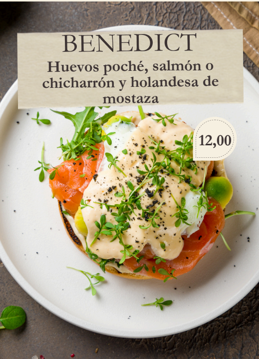
BENEDICT Huevos poché, salmón o chicharrón y holandesa de mostaza