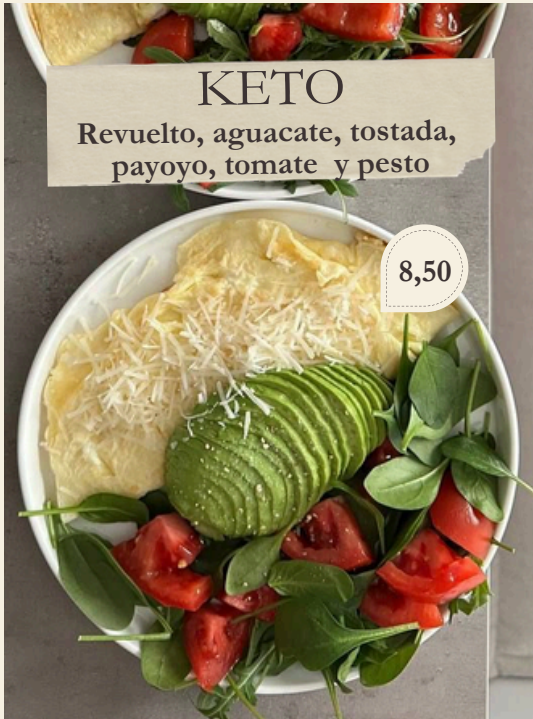
KETO Revuelto, aguacate, tostada, payoyo, tomate y pesto