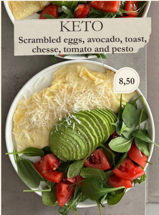
KETO Scrambled eggs, avocado, toast, chesse, tomato and pesto