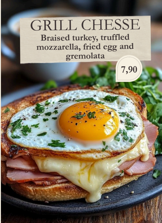
GRILL CHESSE Braised turkey, truffled mozzarella, fried egg and gremolata