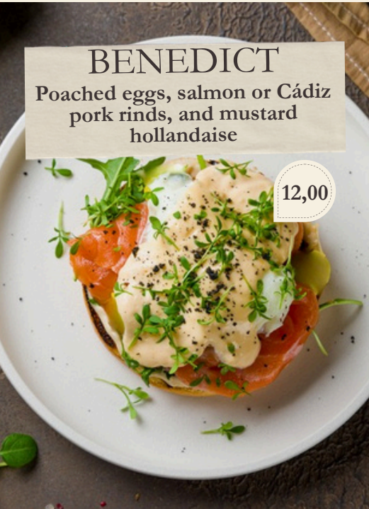
BENEDICT Poached eggs, salmon or Cádiz pork rinds, and mustard hollandaise