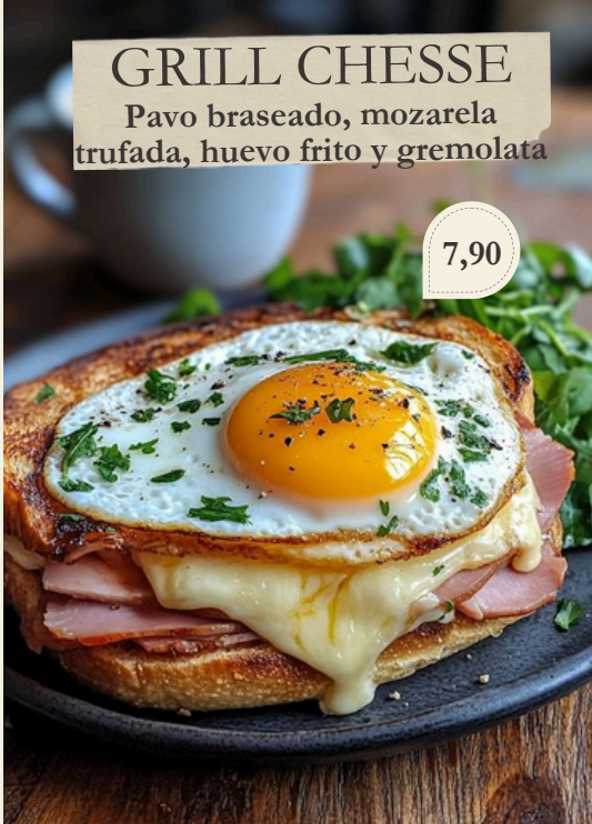
GRILL CHESSE Pavo braseado, mozzarella trufada, huevo frito y gremolata